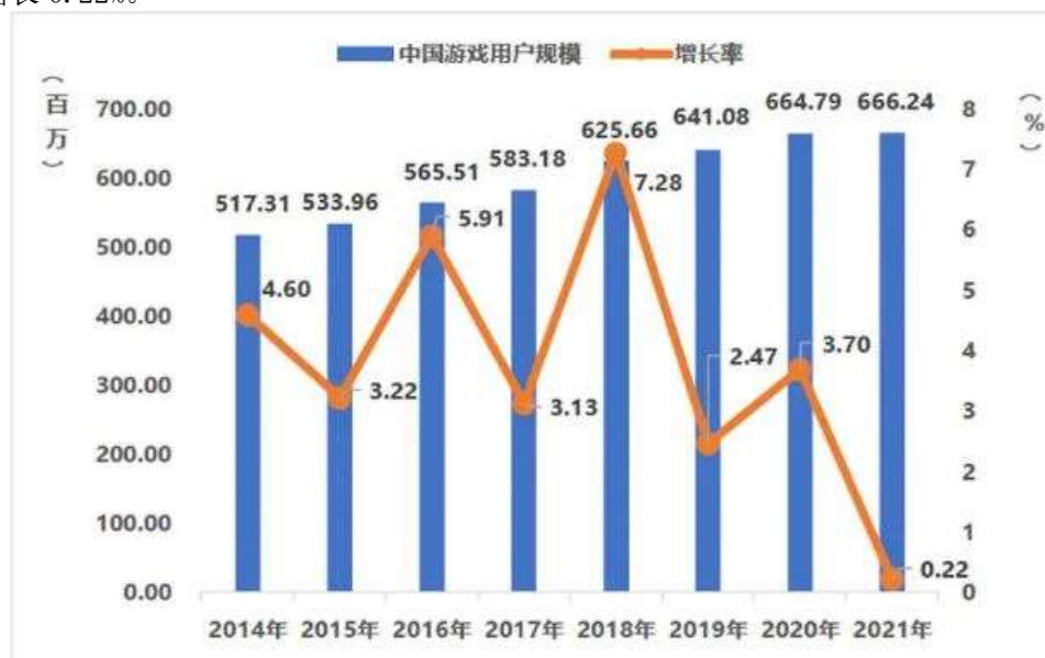
图 2：中国游戏用户规模及增长率

2021 年，游戏人口红利趋于饱和。中国游戏用户规模继续保持稳定增长，用户规模 6.66 亿人，同比增长 0.22%。