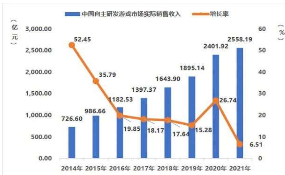
图 3：中国自主研发游戏国内市场实际销售收入及增长率

自主研发游戏海外市场实际销售收入 180.13 亿美元，同比增长 16.59%，增速同比下降约 17%。从近五年的平均增长幅度看，中国游戏出海份额呈稳定上升态势，出海游戏在用户下载量、使用时长和用户付费三个方面均保持较好增长。