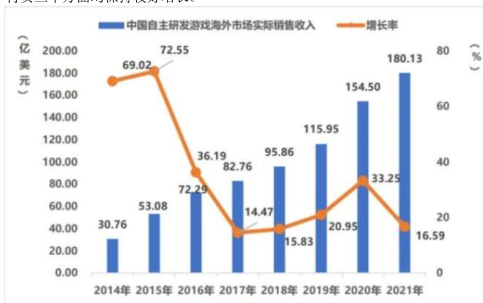
图 4：中国自主研发游戏海外市场实际销售收入及增长率

自主研发游戏海外市场实际销售收入 180.13 亿美元，同比增长 16.59%，增速同比下降约 17%。从近五年的平均增长幅度看，中国游戏出海份额呈稳定上升态势，出海游戏在用户下载量、使用时长和用户付费三个方面均保持较好增长。