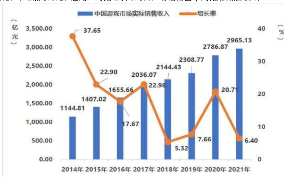
图 1：中国游戏市场实际销售收入及增长率

网络游戏是互联网娱乐产业的重要组成部分。根据中国音数协游戏工委（GPC）与中国游戏产业研究院合作发布的《2021 年中国游戏产业报告》显示：中国游戏市场实际销售收入 2,965.13 亿元，比 2020 年增加 178.26 亿元，同比增长 6.40%，增幅较去年同比缩减近 15%。