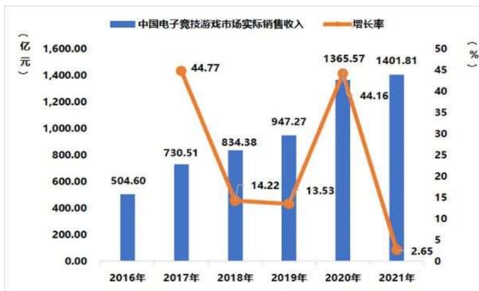
图 5: 中国电子竞技游戏市场实际销售收入及增长率

总体而言，2021 年中国游戏市场完成了用户规模和区域市场的横向拓展，市场占有量和产品认可度有了质的提升，但是游戏产业发展仍然遇到了个别环节的发展瓶颈，主要存在于以下几个方面：第一，防沉迷工作仍有提升空间，未成年人保护措施需要继续拓展；第二，头部企业的集中化趋势明显，市场竞争机制需要进一步改进；第三，中小企业的压力凸显，推动其生态链多样化发展成为未来的努力方向；第四，游戏产品同质化现象依旧明显，精品力作稍显不足；第五，人才培养的难度升级，关于游戏的学术理论研究仍有一定的上升空间；第六，电竞游戏产业基础仍旧薄弱，依然需要国家、地方在技术、人才、资本等多层面、多渠道的大力支持。